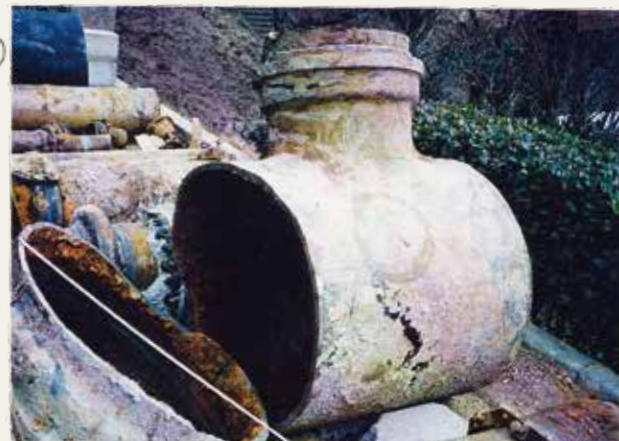
φ900×φ500 T字管 FC 横割り