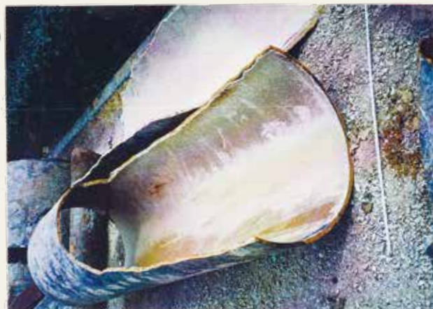
φ800直管 FC 縦割り